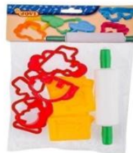
Modeladores de plastilina.